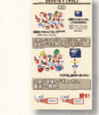
表：カルチュラル 裏：豆知識・備考