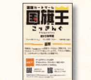
説明書（本書） 裏面：国旗一覧